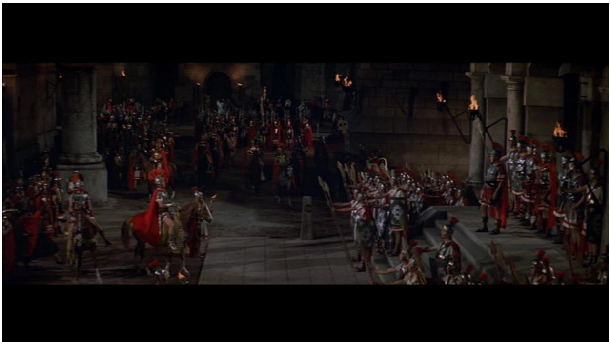
Image 1 : dans quelle ville se dresse ce bâtiment austère ? Jérusalem

17. Questions sur des images tirées du film :