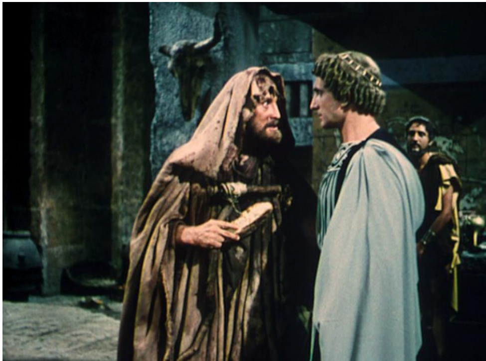
Image 3 : que dit Ulysse à ce personnage ? Pourquoi ? Ulysse conseille à ce prétendant de quitter le palais : il a eu pitié du mendiant et lui a donné du pain, alors Ulysse voudrait l'épargner.

17. Vocabulaire : quel est le sens des mots suivants ?