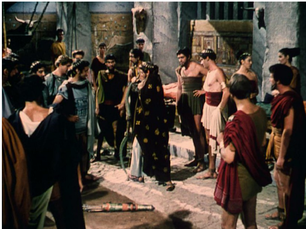
Image 2 : que fait le personnage central de cette image ? Il tente de tendre la corde de l'arc d'Ulysse