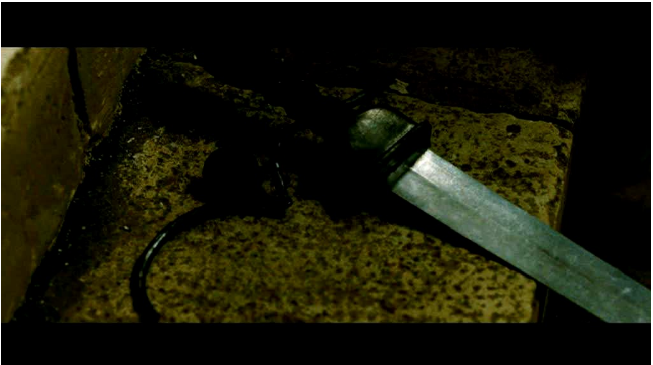
Image 4 : de quoi s'agit-il dans cette scène ? Affranchissement de Davus