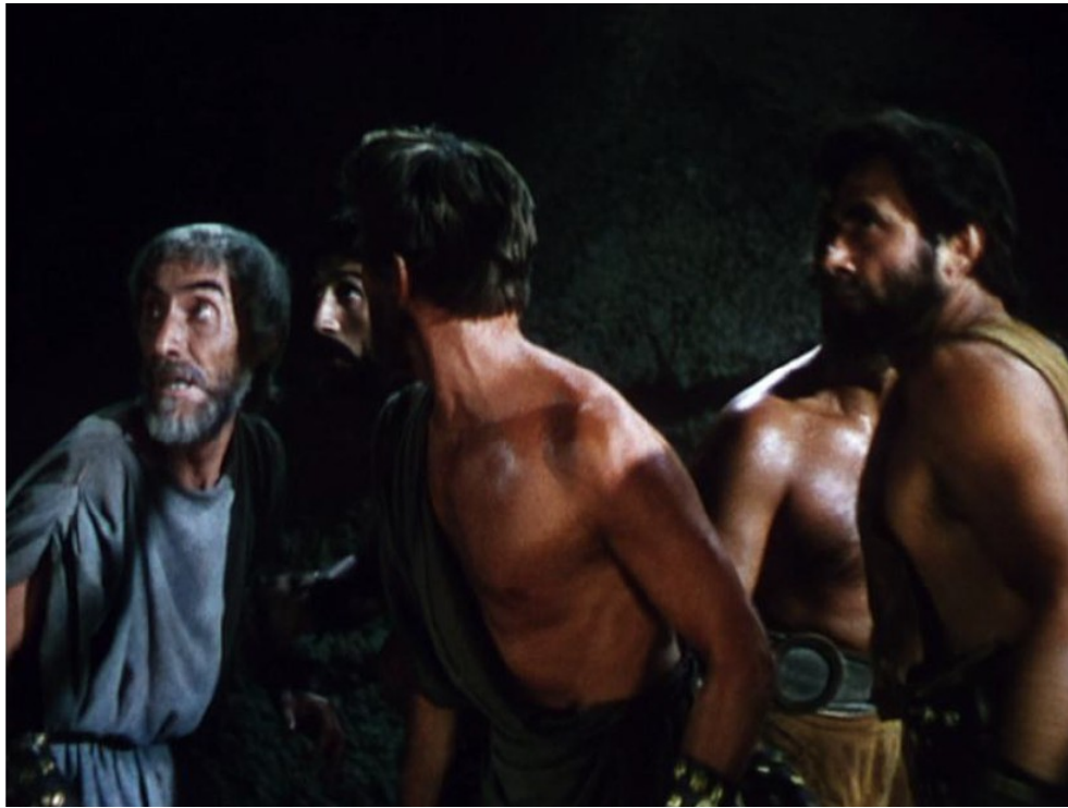
Image 1 : que font Ulysse et ses compagnons dans cette scène ? Ulysse et ses compagnons pressent du raisin pour faire du vin dans la grotte du Cyclope.