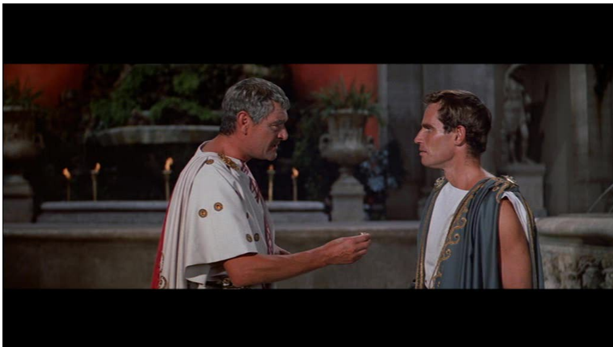
Image 3 : quel nouveau statut est accordé à Ben-Hur lors de cette fête/soirée ? Ben-Hur est adopté par Quintus Arrius et devient Quintus Arrius le Jeune.

a. qui assiste à la scène du haut de la maison ? Ben-Hur et sa sœur b. de quoi la famille est-elle ensuite accusée ? d'avoir voulu tuer le nouveau Procurateur c. quelle est la vraie cause de l'accident ? des tuiles descellées sont tombées quand Tirza s'est penchée pour mieux observer le défilé et le passage du nouveau représentant de Rome.