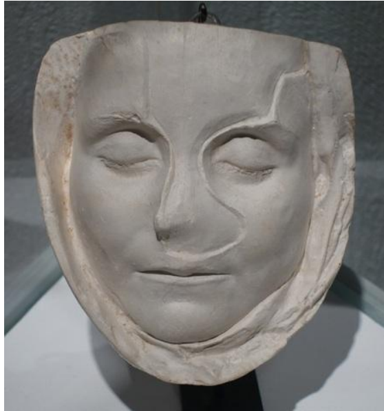
Musée gallo-romain de Fourvière

La sépulture de la fillette a été découverte avec sa pierre tombale sur la colline de Fourvière, à Lyon, à la fin du 19 e siècle.